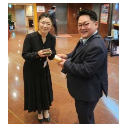
益田青年会議所理事長と