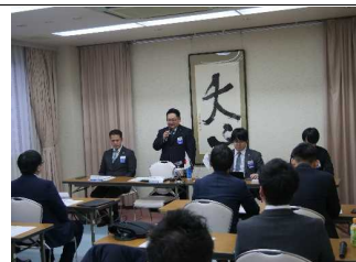
1月例会・定時総会