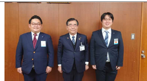
二宮大洲市長と記念撮影