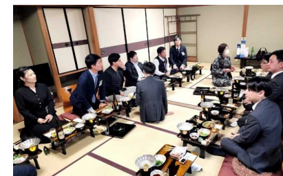
日本三大芋煮 LOM の LOM ナイト