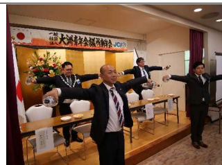
新年会(委員長対抗による余興)