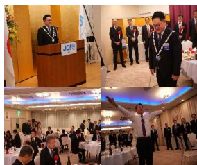
新年会(挨拶・先輩のエール他)