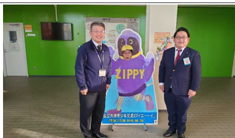
中尾国立大洲青少年交流の家所長と記念撮影